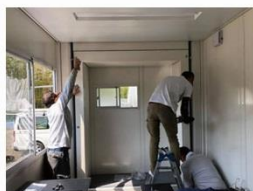
スペースカプセル