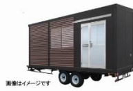
③スモールオフィスパッケージ 3.6坪タイプ