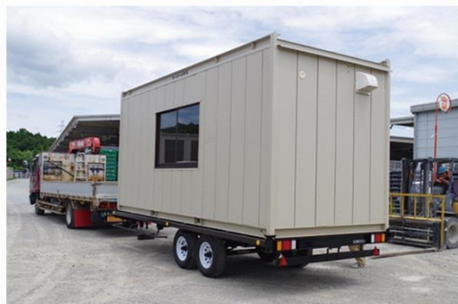
写真1.構内走行試験

これまでは一般貨物自動車運送事業の営業所／休憩所と車庫は最大10km（大都市圏）以内において運営せざるを得ない状況でありました。この認可により 車庫と営業所は併設することが可能 となりますので車輛点検に始まる点呼業務を確実にスムーズに実施でき、輸送の安全につながるものと確信しています。