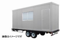
①標準パッケージ 3.6坪タイプ