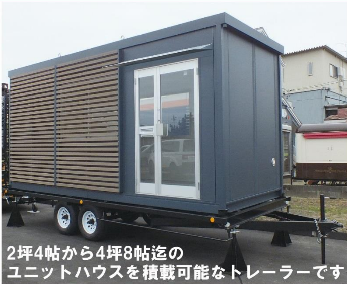
2坪4帖から4坪8帖迄の ユニットハウスを積載可能なトレーラーです