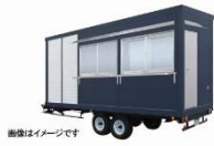
②スタンドショップパッケージ 3.6坪タイプ