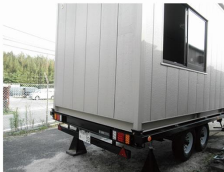
写真2.営業所としての設置状況

認可申請に先立ち、予備検査終了後このトレーラーの構内道路走行試験ではハウスを積載した状態で実際にけん引走行を行い、電磁ブレーキテストなどの車輛としての性能も確認しました。